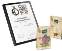
German Design Award 2020